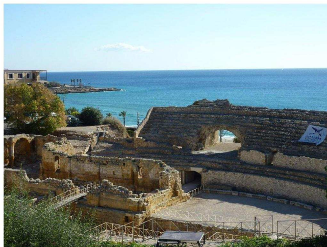
Tarragona : Amphithéâtre Romain