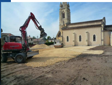
Place H. de Coste