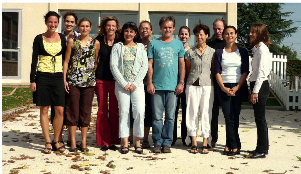
Equipe enseignante année scolaire 2010-2011