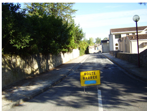
Rue des Cabris

Reprofilage en grave bitume et enduit bicouche prégravillonné