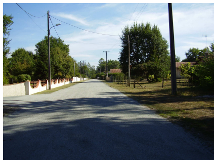
Allée des genêts