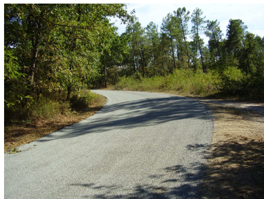
Petite portion route du bois de Savis