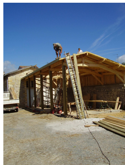
Reconstruction du hangar des services techniques communaux