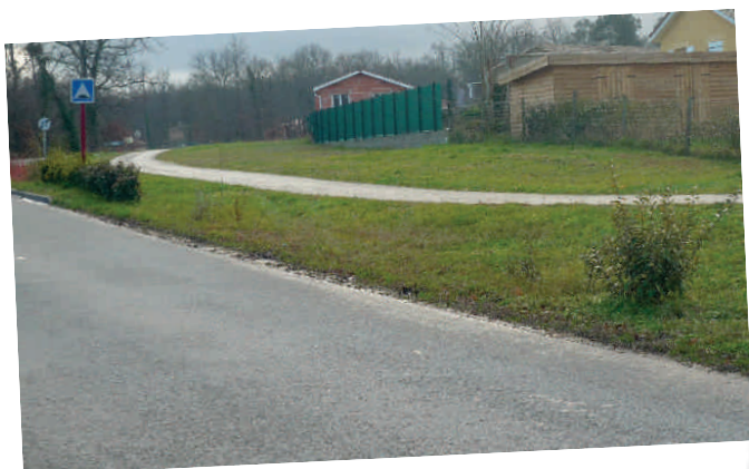
VOLS DE PLANTATIONS