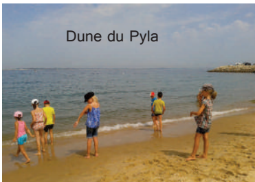
Dune du Pyla