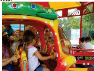
les 3-6 ans à la coccinelle

Saison 2013/2014 : l'accueil est ouvert tous les mercredis et les vacances scolaires sauf les vacances de Noël et la première quinzaine d'août.