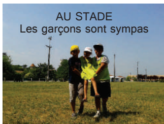
AU STADE Les garçons sont sympas