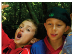
ALORS LES GARÇONS !?