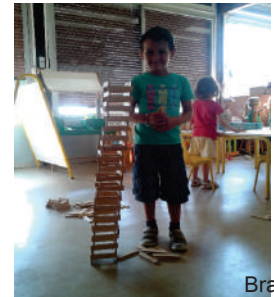
Bravo Valentin !