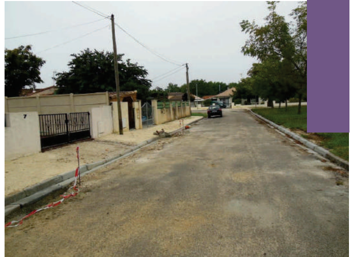
Travaux voirie au lotissement Pédesclaux

Afin d'améliorer la sécurité et le cadre de vie du lotissement Pédesclaux, la Mairie a retenu la Société C2TP qui réalise la réfection de la voirie, des trottoirs et bordures. Les deux aires de verdure sont également reprises dans leur ensemble. Le chantier a débuté mi-juillet et sera terminé fin octobre. Le montant des travaux s'élève à 98274,12 €.