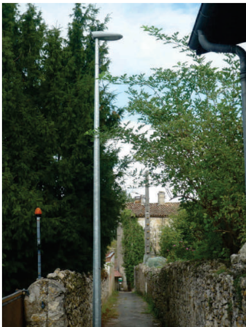
Un point lumineux a été installé dans le Chemin du Relais de Poste afin de sécuriser l'endroit.