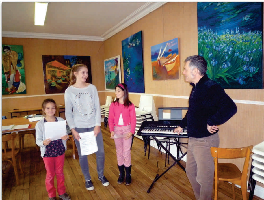
« La Clé des Vignes »

Ecole de musique – Portets-Castres-Virelade