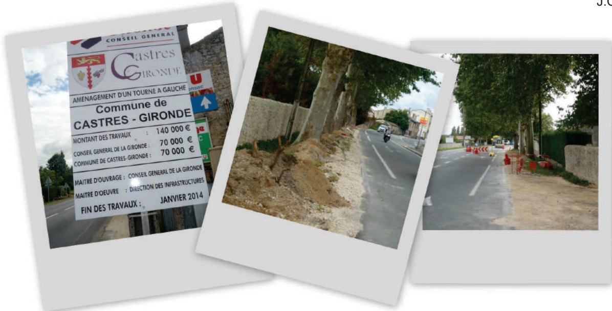
Tourne à gauche, les travaux ont commencé

Les travaux du « tourne à gauche » devant la gendarmerie, financés à 50% par la Mairie et 50% par le Conseil Général, ont commencé. Les lignes hautes tensions et du téléphone ont été enterrées et 11 points lumineux seront installés le long de la RD 1113, côté droit en allant vers Langon, depuis la gendarmerie jusqu'au cimetière. Les piétons apprécieront le trottoir d'accès sécurisé menant au cimetière.