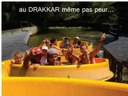
au DRAKKAR même pas peur...