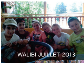
WALIBI JUILLET 2013