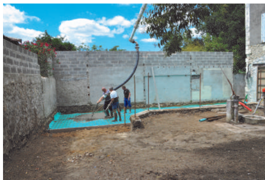
Terrassement et coulage de la chape réalisés par les employés communaux