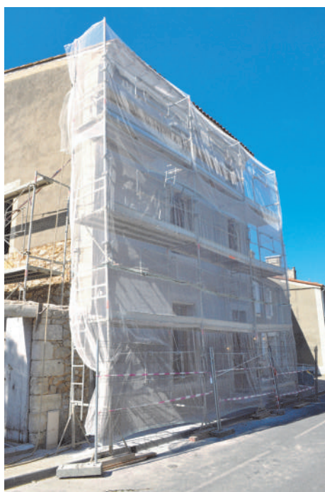
Rénovation des façades