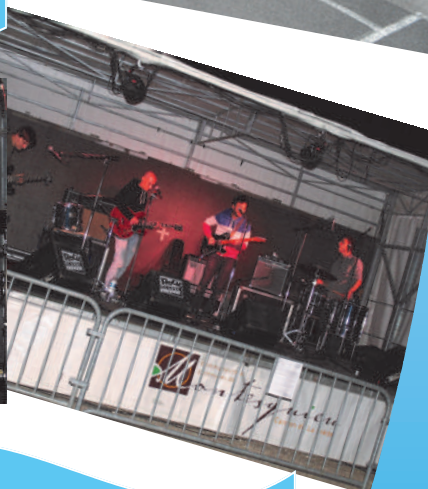
Une nuit sous les étoiles 4 septembre