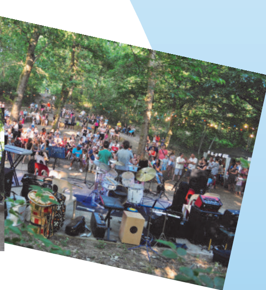
Musiques à Savis le 6 juin