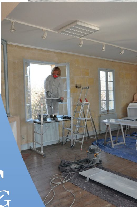
Peinture des huisseries et des volets du presbytère