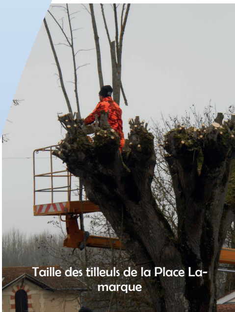
Taille des tilleuls de la Place La-marque