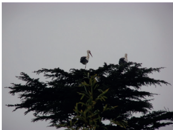
Photo prise par M. Jeantet le 20 février à 18 h Jardin du Prieuré de Castres - Gironde