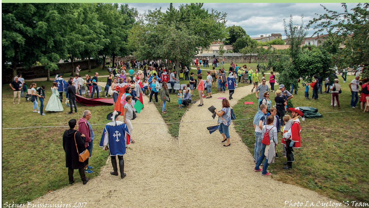
Scènes Buissonnières 2017

Le Festival SCENES BUISSONNIERES est inscrit à la Programmation 2018 des Scènes d'été en Gironde et bénéficiera d'une meilleure visibilité sur le département. Il accueillera près de 40 groupes d'amateurs et de professionnels, soit plus de 50 spectacles, TOUS GRATUITS !