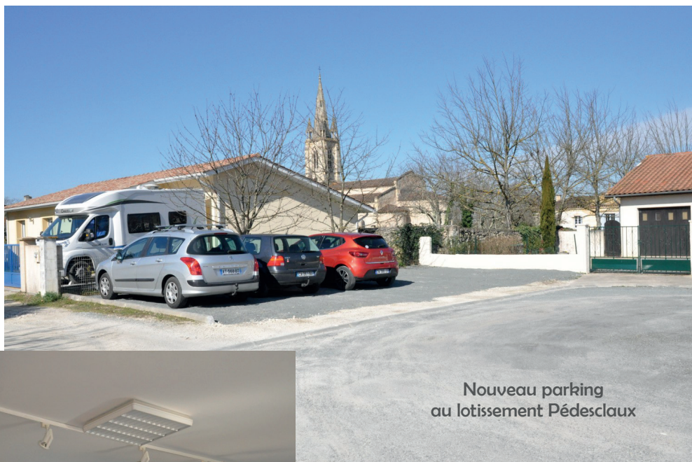
Nouveau parking au lotissement Pédesclaux