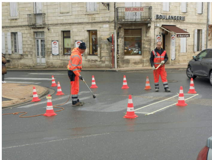
Reprise de la signalisation horizontale sur toutes les voies de la commune.